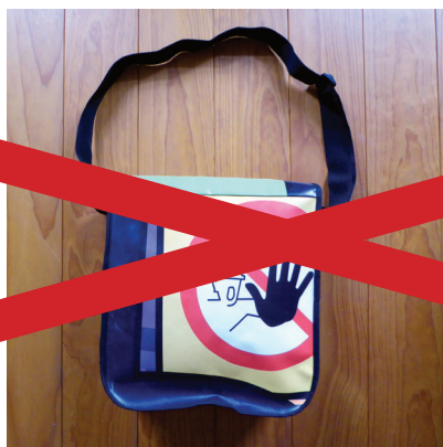
Tasche Hochformat Vor- und Rückseite Einzelstück Nummer: 08