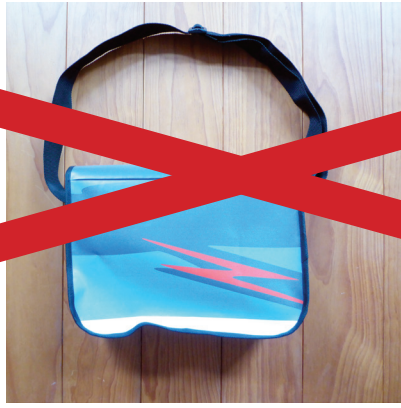
Tasche Querformat Vor- und Rückseite Einzelstück Nummer: 05