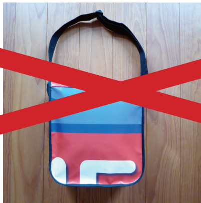
Tasche Hochformat Vor- und Rückseite Einzelstück Nummer: 07