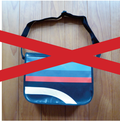
Tasche Querformat Vor- und Rückseite Einzelstück Nummer: 06